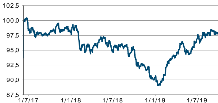
Altitude Juin 2027